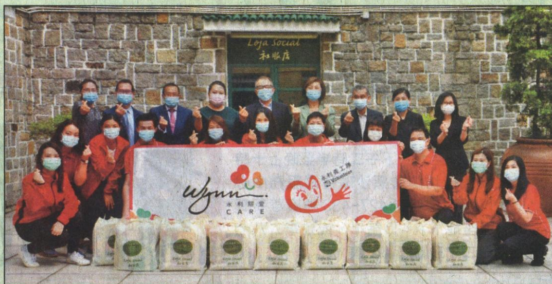
出席儀式的仁慈堂及永利澳門代表與義工等留影